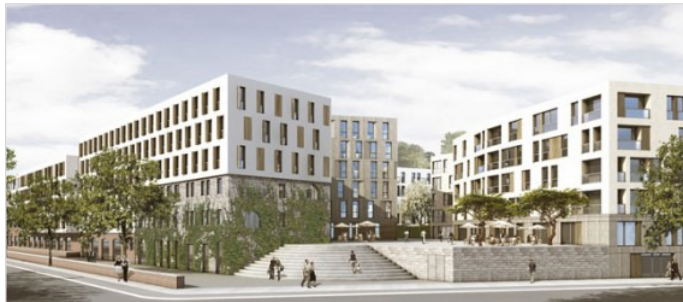
Eine Stadtterasse und ein Stadtplatz sollen das Entree zum neuen Quartier Möckernkiez bilden.

Es ist das wohl ungewöhnlichste Bauprojekt in Berlin, denn nicht ein Bauträger, sondern eine inzwischen zur Genossenschaft zusammengeschlossene Gruppe von Bürgern will in Kreuzberg ein neues Stadtquartier mit etwa 400 Wohnungen im Passivhaus-Standard bauen.