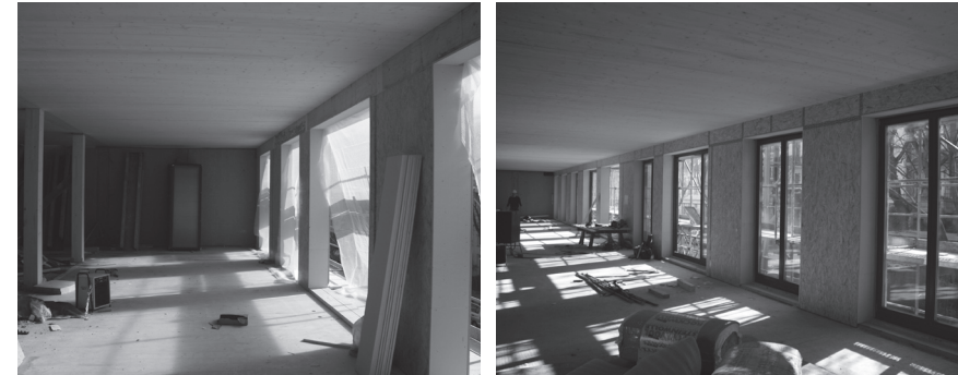
Abb. 7 und 8: Rohbau Prototyp 3XGRÜN mit Holzmassivdecken und Holzrahmenbau- wänden

Der mehrgeschossige Holzbau schließt in der Regel den Einsatz von holzsichtigen Oberflächen aus: Decken und Wände werden gekapselt und die Verwendung von holzsichtigen Werkstoffen in der Fassade ist auch mit ausgefeilten Brandschutzkonzepten nur schwer zu realisieren. Nun kann man argumentieren, dass auch ein Massivbau seine Konstruktion hinter vorgehängten Fassaden oder Wärmedämmverbundsystemen verbirgt. Doch Bauherren, die sich für ei-