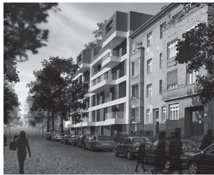
Abb. 1: Straßenansicht Mehrfamilienhaus Görschstraße