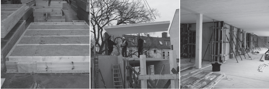
Abb. 9: Vorfertigung der Wandelemente im Abbundwerk Staaken